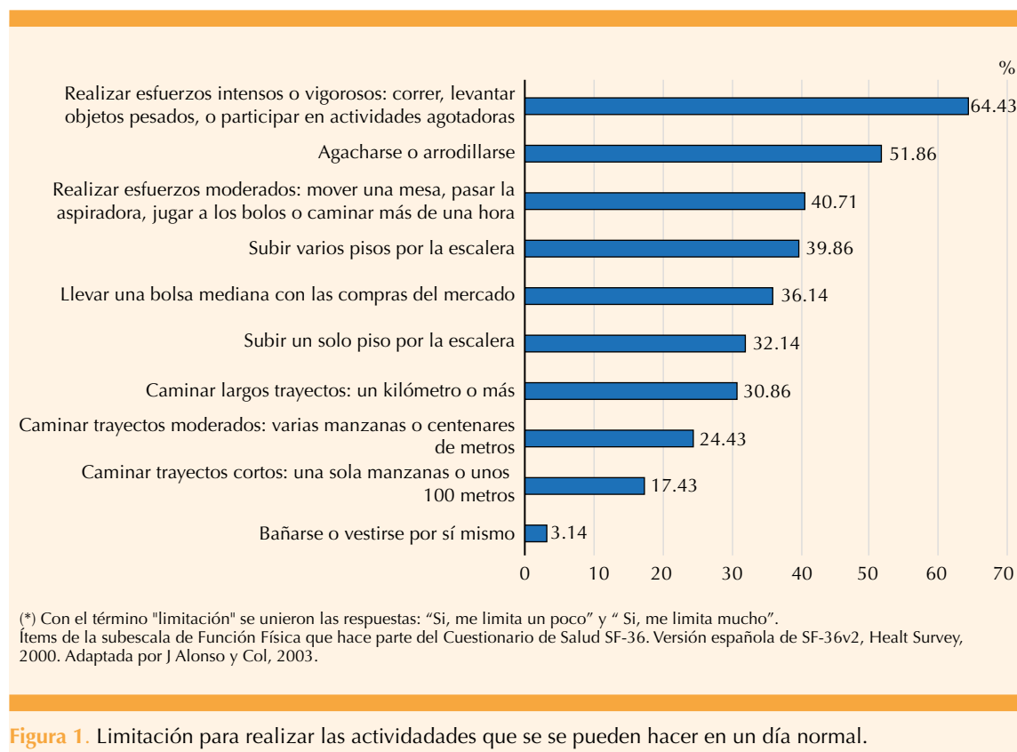
Figura 1. Limitación para realizar las actividades que se se pueden hacer en un día normal.

La histerectomía en premenopausia, con o sin ooforectomía, se asoció con limitación para llevar a cabo actividades vigorosas o moderadas, lo que no se observó si la cirugía se practicó durante los años de posmenopausia. Hallazgo de interés, aunque sin posibilidad de establecer comparaciones porque no se identificaron estudios similares. A pesar de ello sí se han señalado otros efectos no deseados de la histerectomía. La Iniciativa de Salud de la Mujeres 35 informó que la histerectomía con ooforectomía se relacionó con infarto cardiaco y muerte por coronariopatía y el riesgo fue mayor conforme a menor edad se practicó la ooforectomía. La histerectomía antes de los 45 años incrementó dos veces el riesgo de accidente cerebrovascular. 36,37,38 Finch y colaboradores 16 encontraron que después de la